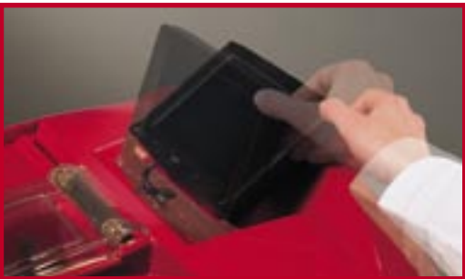
Adjustable Touch Screen Touch Screen orientabile

VERSA legge e rileva le cifrature della chiave tramite un innovativo tastatore elettronico e trova i relativi codici nel database.